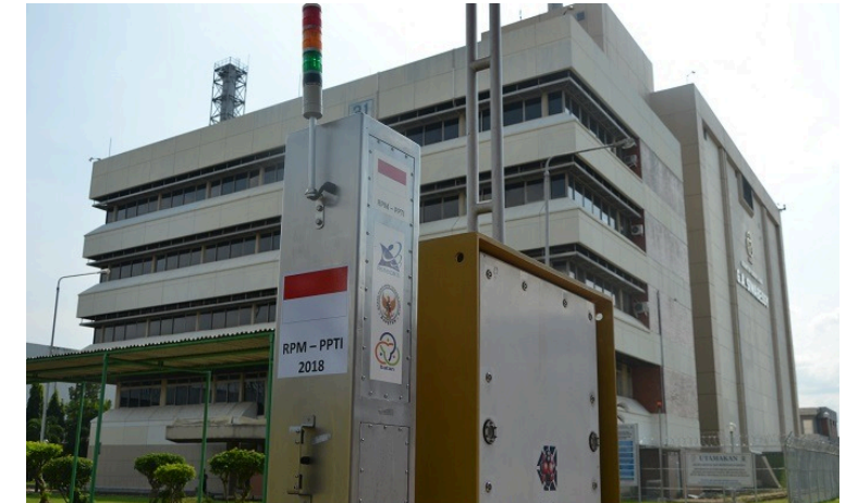
RPM hasil kegiatan PPTI Konsorsium BATAN, BAPETEN, UGM dan PT. Len Industri (Persero) telah terpasang di Main Gates Security (MGS) BATAN Kawasan Nuklir Serpong, Tangerang Selatan, Kamis (13/12/2018)